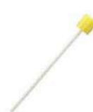
口腔ケアスポンジ