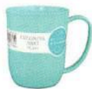
プラスチックコップ