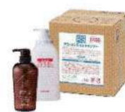
リンスインシャンプー